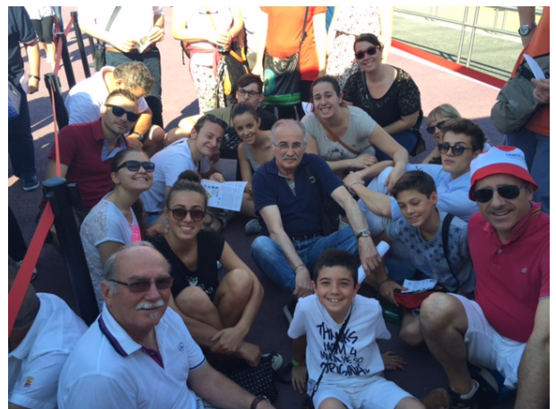
Gita Expo Milano: l'attesa all'ingresso

E' giusto anche sottolineare l'impegno di alcuni consiglieri della Proloco che si sono adoperati per mantenere e risistemare i giochi per bambini dell'area verde, per potare i lecci della piazza sovrastante l'area verde, per manutenzionare l'edificio dell'area verde con particolare attenzione alla manutenzione straordinaria dell'area cucina per la quale sono stati acquistati un nuovo frigorifero, una nuova cucina a gas, una friggitrice e un bollitore.