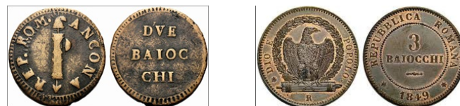
Baiocchi Repubblica Romana