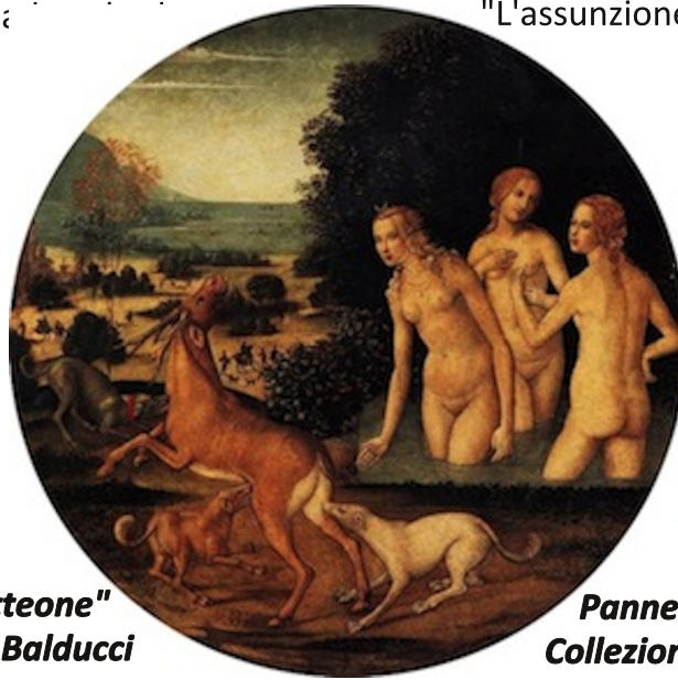
"Diana e Atteone" Matteo Balducci

Balducci risentì però soprattutto degli influssi artistici e pittorici del Pinturicchio. Gli viene assegnata una tavola con "L'assunzione e Santi" nella chiesa di Santo Spirito a Siena e sulla base di ciò gli viene attribuita la paternità di varie altre opere custodite nella pinacoteca di Siena. Bellissimo è il pannello di "Diana e Atteone", che vi proponiamo.