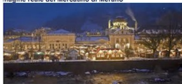
immagine reale del Mercatino di Merano

Quota partecipazione € 150,00 (a persona) Bambini fino a 3 anni gratis